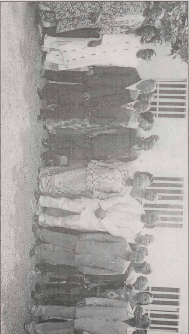
Le ministre Jean Coulibaly, en bas, posant avec les participants

Suite à la recommandation du Sommet de la terre tenu en 2002, les Parties à la Convention sur la biodiversité ont négocié un protocole que la 14 ème Conférence des Parties à ladite convention a adopté en 2010 à Nagoya au Japon. Cet accord appelé « Protocole de Nagoya » est destiné à réglementer l'accès aux ressources génétiques des plantes, des micro-organismes et le partage juste et équitable des avantages tirés de leur utilisation commerciale par les tiers. Le gouvernement du Burkina a procédé à la signature de cet instrument international le 20 septembre 2011 et l'étape suivante reste sa ratification par l'Assemblée nationale. D'où la tenue de cet atelier d'appropriation au profit des parlementaires et des représentants des structures techniques de l'Etat dont l'objectif global est de partager, le plus largement possible, l'information sur le contenu et le mécanisme d'application du Protocole. Ce