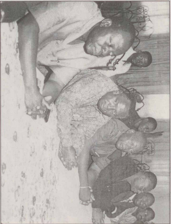
Une vue des participants attentifs à la communication sur les origines et justification du Protocole de Nagoya