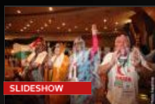
Conférence internationale sur le droit de la femme à la résistance : Le combat