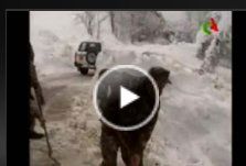
L'ANP porte assistance aux populations isolées : Sur le front de